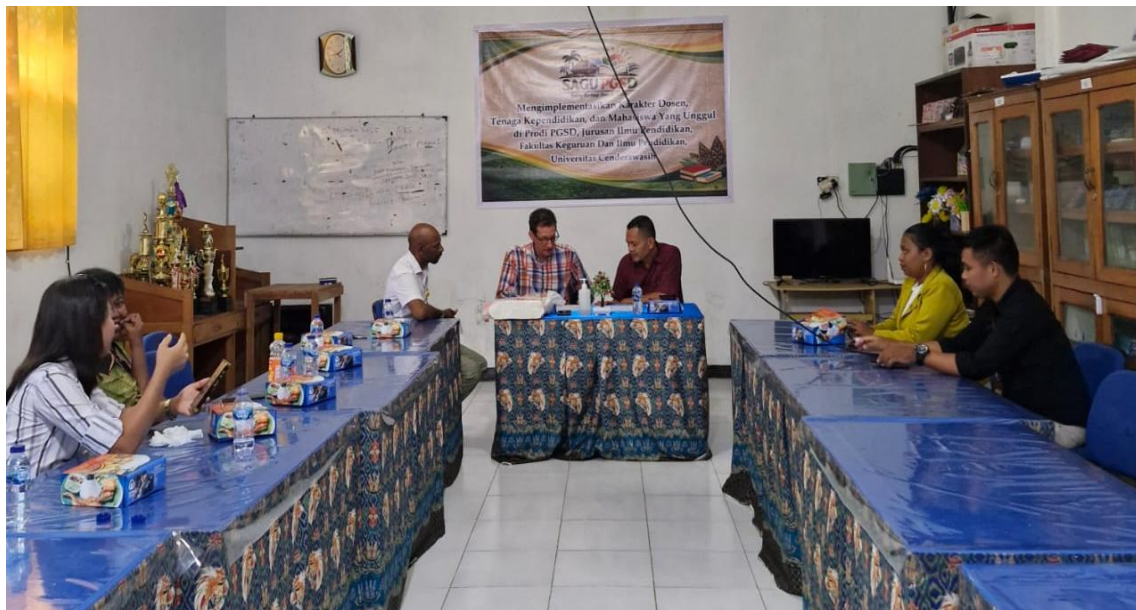
Gambar 2. Rapat Evaluasi Panitia bersama Pemateri

dan pemateri, diharapkan kualitas penyelenggaraan kegiatan dapat terus ditingkatkan secara lebih terarah dan profesional.