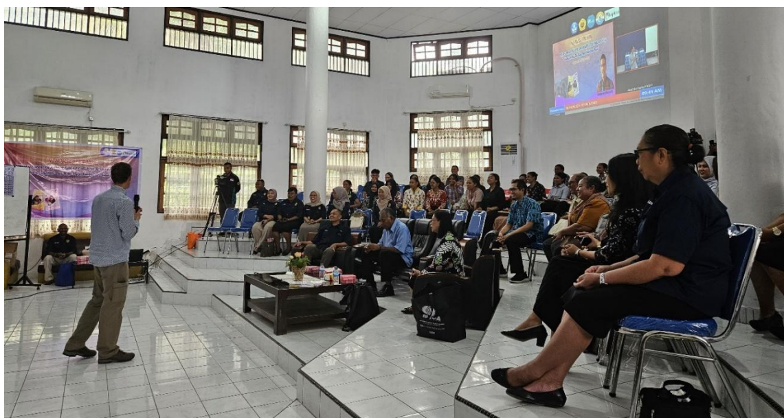
Gambar 1. Peserta Menyimak Penjelasan Materi dengan Fokus

Februari 2026. Pembagian waktu ini memungkinkan peserta mempelajari materi secara lebih fokus. Kegiatan hari pertama dimulai pukul 09.00 WIT dengan pembukaan resmi oleh Dekan FKIP. Materi Literasi Kontekstual kemudian disampaikan oleh Bapak Martijn van Driel dan diikuti sesi tanya jawab. Sebagai bagian dari evaluasi pembelajaran, peserta diberikan tugas terkait materi yang telah dipelajari. Kegiatan hari pertama selesai pukul 15.00 WIT.