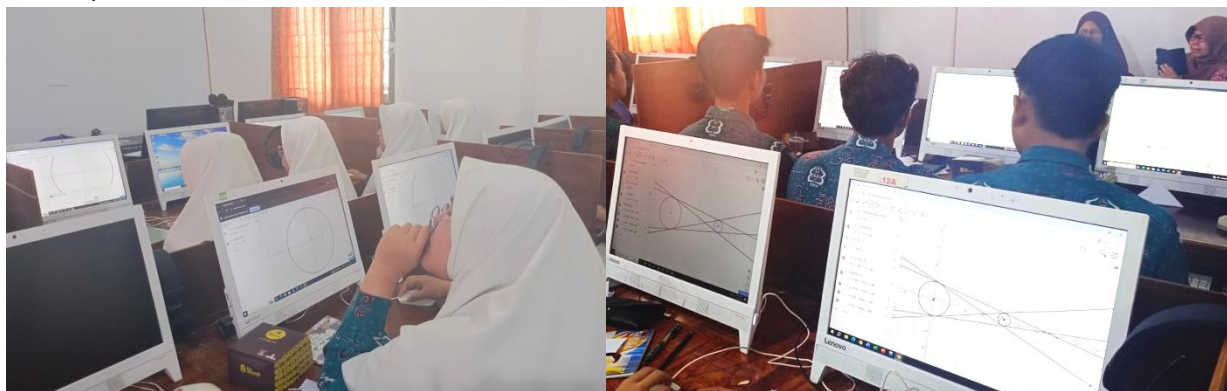
Gambar 4. Praktik Penggunaan GeoGebra oleh Siswa SMA IT IQRA' Kota Bengkulu

memandu siswa dan guru untuk menjalani pengalaman belajar yang lebih sistematis dan terstruktur. Pada tahap awal, pemateri memberikan instruksi rinci mengenai cara membuka program GeoGebra pada komputer, kemudian secara bertahap menuntun peserta untuk melaksanakan praktikum sesuai langkah-langkah yang tertera dalam E-LKPD. Dengan pendekatan ini, kegiatan praktik tidak hanya berlangsung mekanis, tetapi juga menghadirkan suasana pembelajaran berbasis teknologi yang menekankan partisipasi aktif dan keterlibatan penuh dari semua peserta.