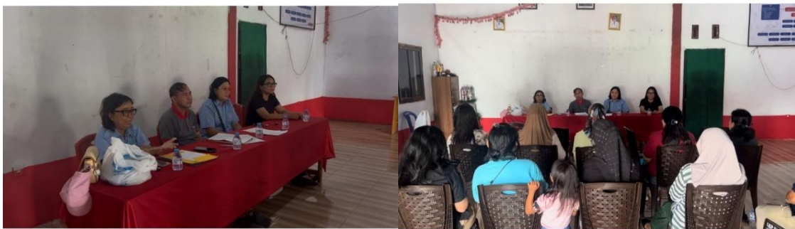
Gambar 3. Pelaksanaan Kegiatan di Balai Desa Likupang Dua

Selanjutnya setelah di lakukan observasi dan Wawancara ditemukan bahwa salah satu masalah utama adalah kurangnya pengetahuan mitra dalam manajemen pemasaran UMKM. Setelah itu disepakati tanggal dan waktu pelaksanaan kegiatan oleh tim dosen dan mitra para pelaku UMKM. Tim melaksanakan penyusunan materi yang di butuhkan terkait dengan masalah utama yaitu manajemen pemasaran.