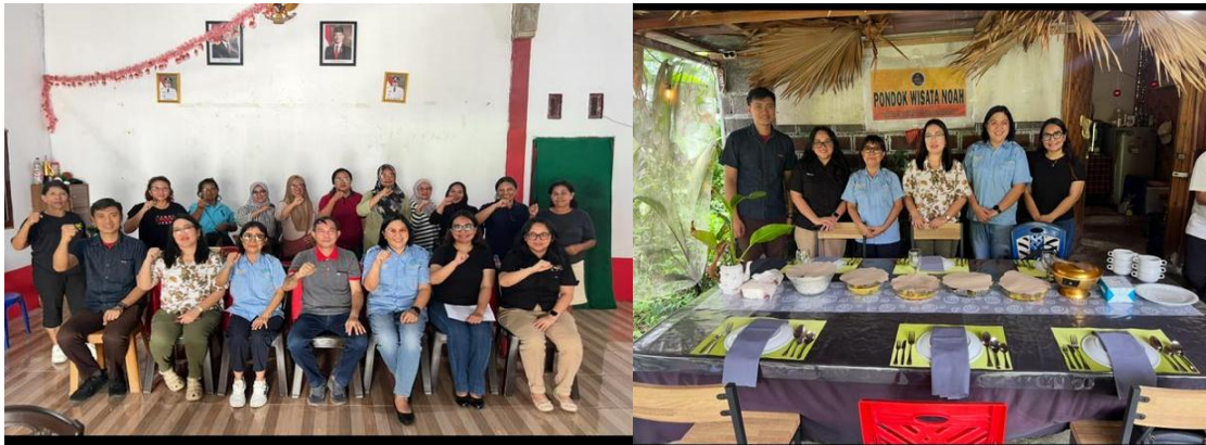
Gambar 2. Foto Bersama dengan Para Peserta dan Pemerintah Desa